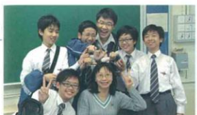
我和老師有個約會