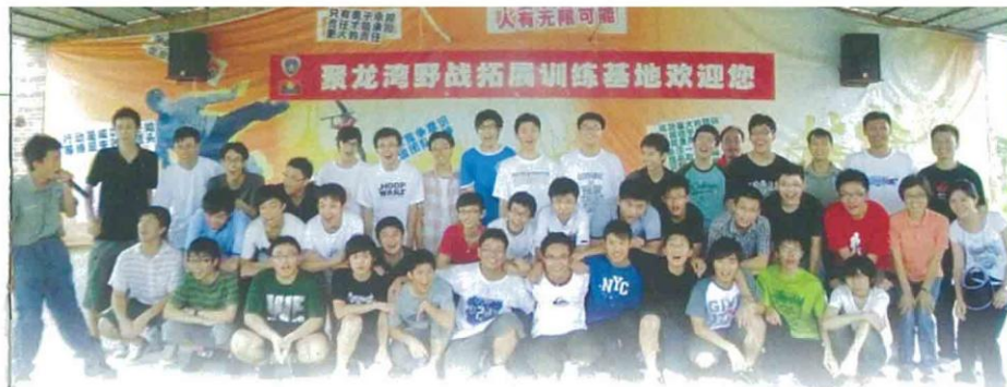
青年生活體驗活動