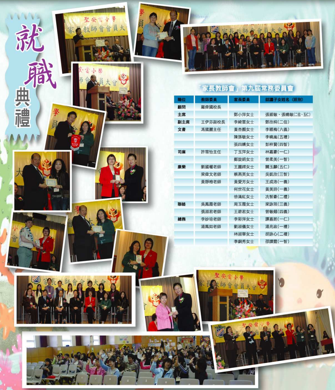
「家長教師會」第九屆常務委員會